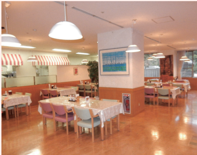
レストラン「ボナサルーナ」