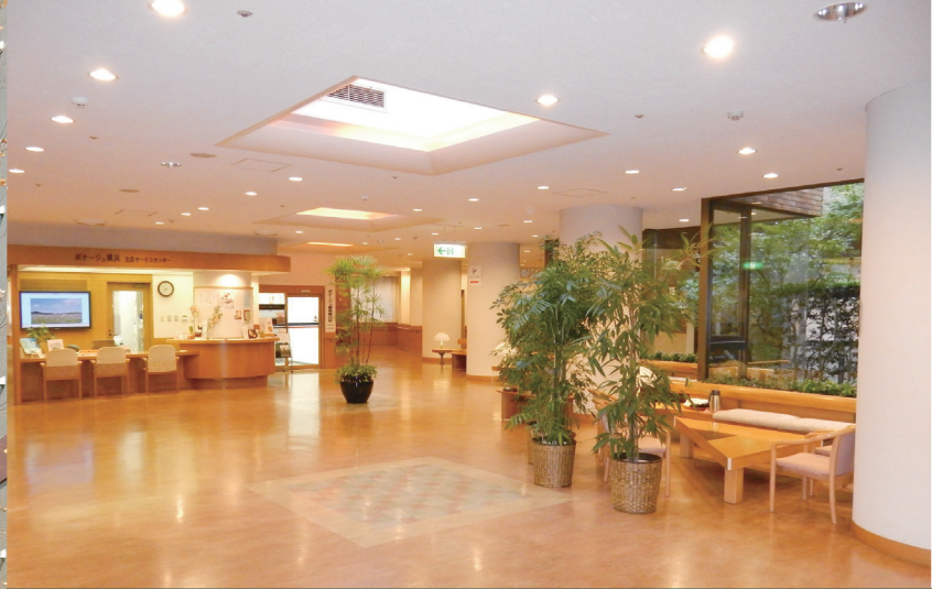
「ボナージュ横浜」エントランスホール