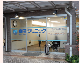
診療所「森田クリニック」