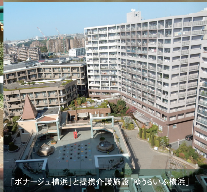
「ボナージュ横浜」と提携介護施設「ゆうらいふ横浜」