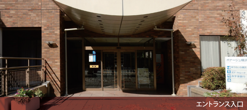
エントランス入口