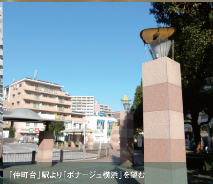
「仲町台」駅より「ボナージュ横浜」を望む