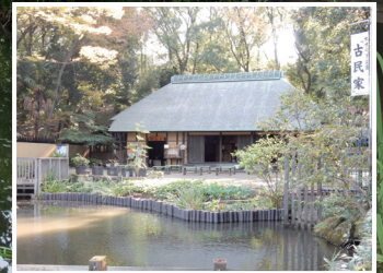
「ボナージュ横浜」に隣接する「せせらぎ公園」と、移築された「古民家」